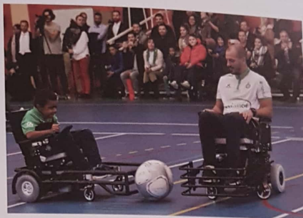
L'équipe de foot fauteuil ASSE Cœur-Vert Eovi Mcd Mutuelle créée en 2016

Selon le baromètre d'image 2016-2017 réalisé par l'Institut Ipsos, l'ASSE est ainsi perçue comme le club qui défend le plus de valeurs mais aussi comme le club le plus sympathique.