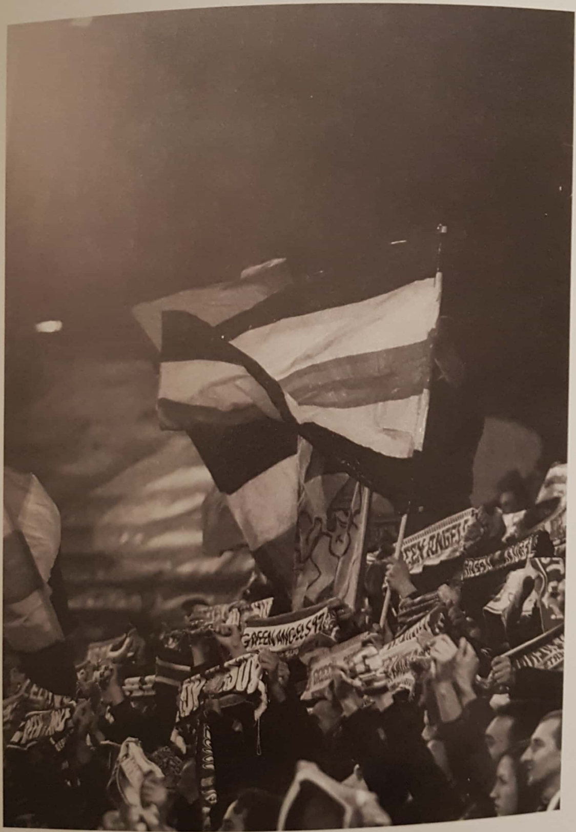
Le public du stade Geoffroy-Guichard