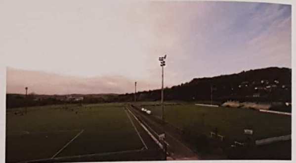
Le centre d'entraînement et de formation situé à L'Etrat

L'AS Saint-Etienne et Saint-Etienne Métropole ont officialisé en 2018 un nouvel accord concernant la mise à disposition du stade Geoffroy-Guichard. La collectivité a mis l'enceinte à disposition du club 365 jours sur 365 et pour une durée de 12 ans à compter du 1er juillet 2018.