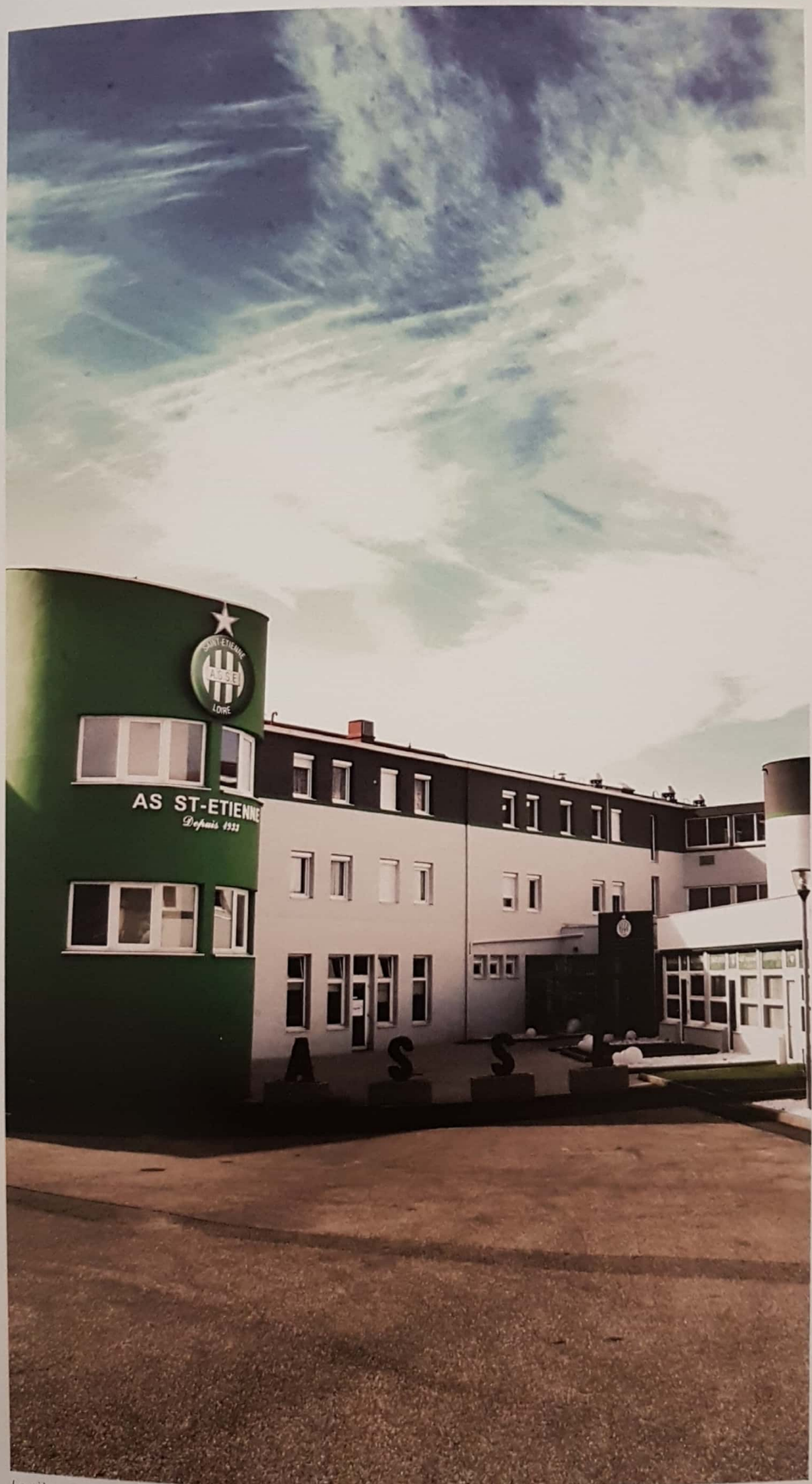
Le siège social de l'AS Saint-Etienne