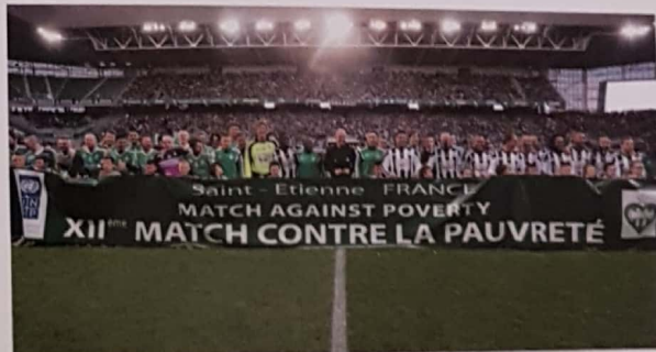
Match contre la pauvreté, 20 Avril 2015, Saint-Etienne