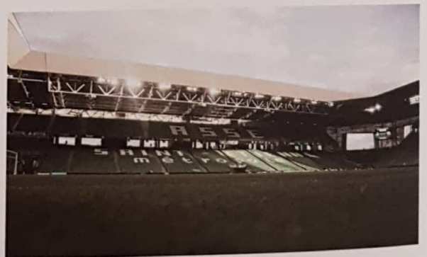
Le stade Geoffroy-Guichard