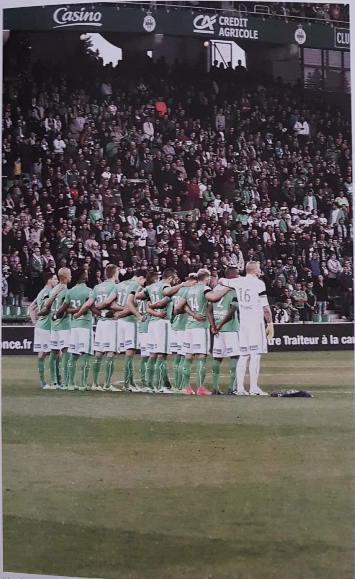
Les valeurs de solidarité et de partage unissent supporters et joueurs